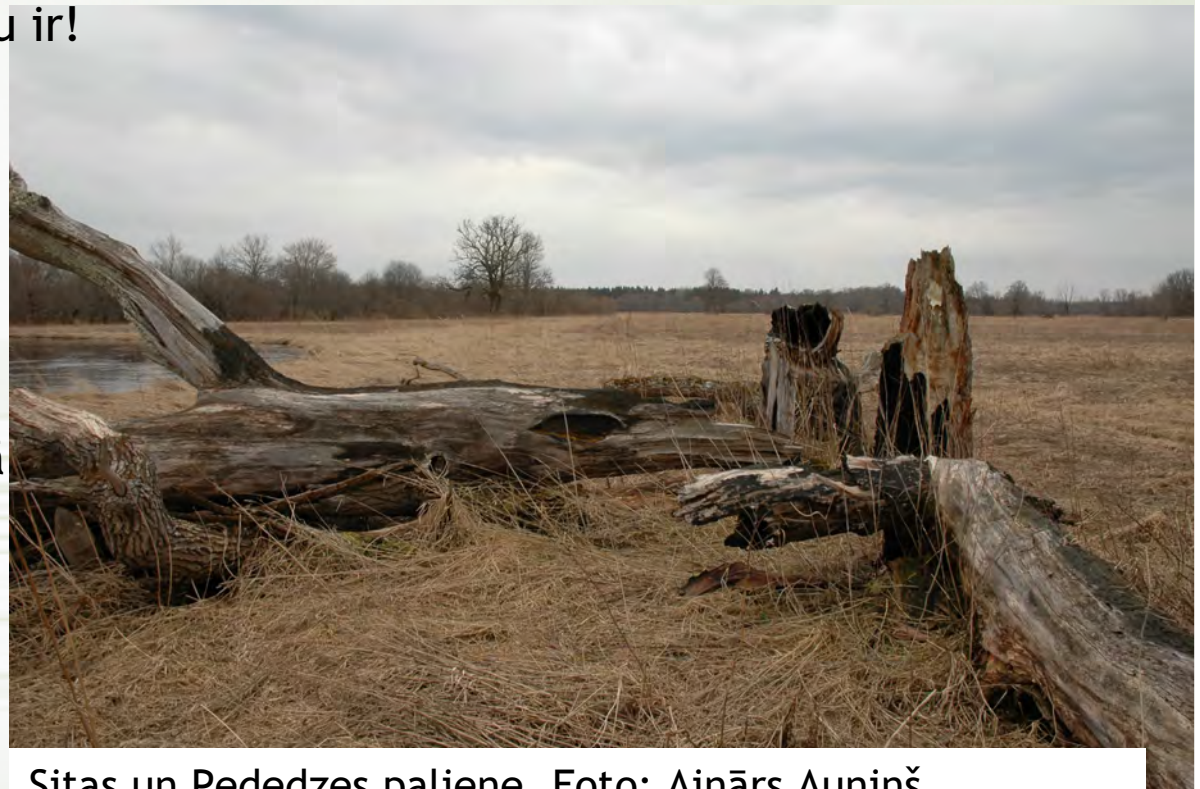
Sitas un Pededzes paliene.