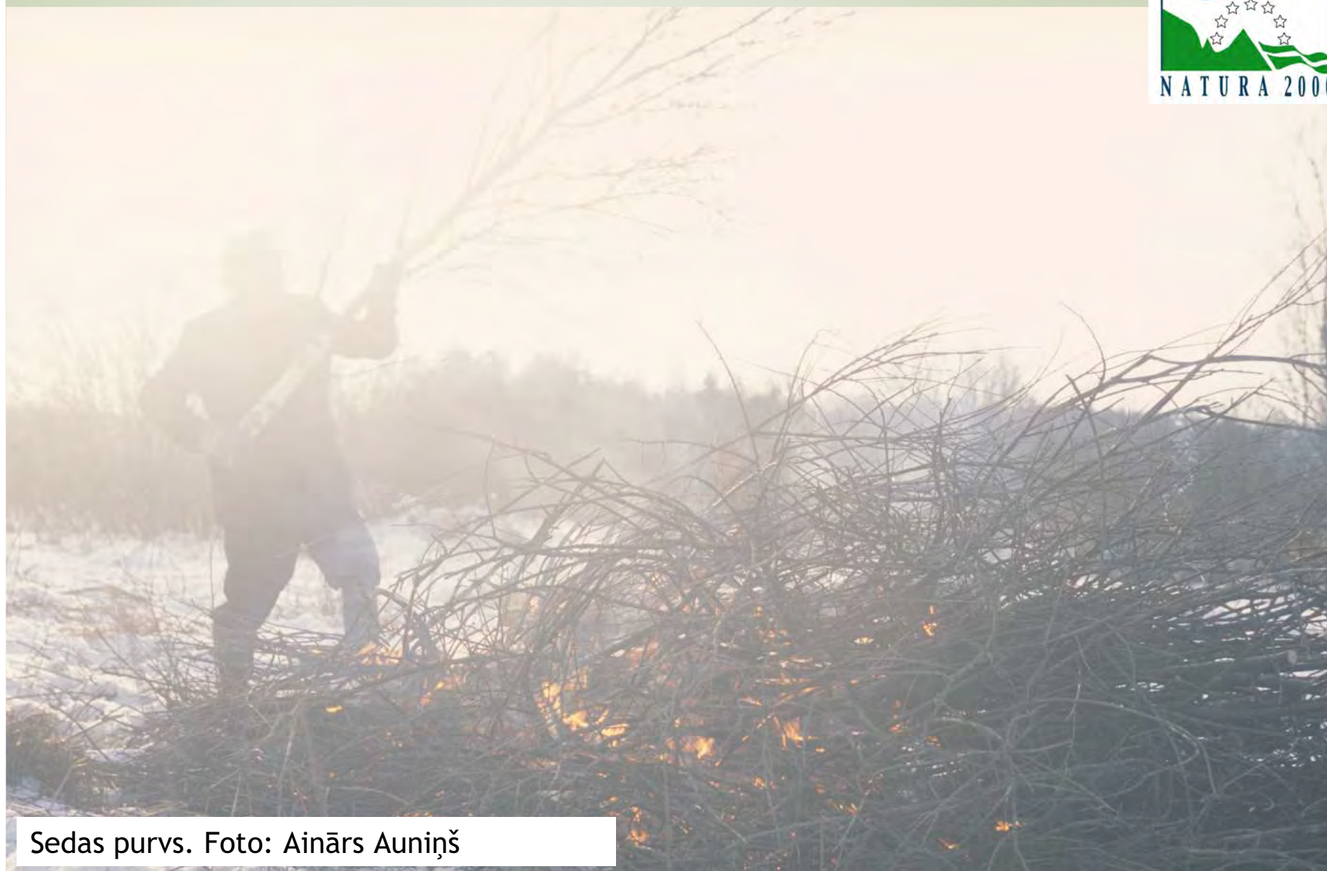
Sedas purvs.