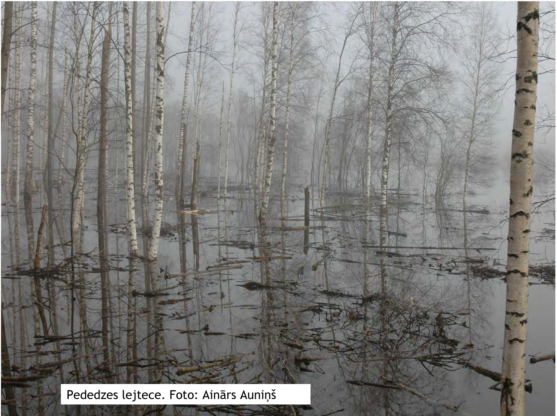
Pedezes lejtece.