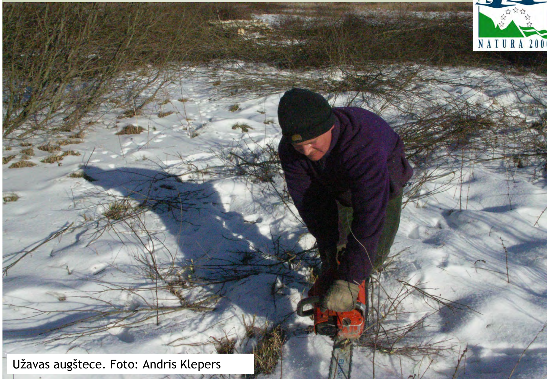
Užavas augštece.