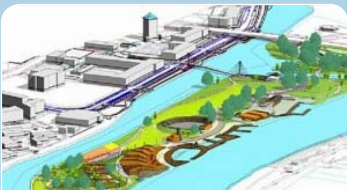
Jelgavas Pasta salas projekta skice

Arī Jelgavā taps pilsētas attīstībai nozīmīgs un apjomīgs projekts „Pasta salas labiekārtošana un upju kā tūrisma un aktīvās atpūtas produkta veidošana Jelgavā”, kura iet-