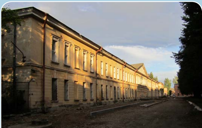
Daugavpils cietokšņa teritorijas labiekārtošanas darbu ietvaros tiek sakārtotas gājēju ietves un ielas.

Savukārt Daugavpils pilsētas domes projekta „Daugavpils cietokšņa Nikolaja ielas un tās apbūves atjaunošana” ietvaros paredzēta Daugavpils (Dinaburgas) cietokšņa,