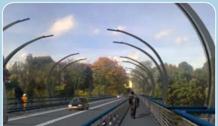
Tilta pār Gauju Valmierā projekta skice

Valmieras pilsētas pašvaldība īsteno vērienīgu projektu „Tilta pār Gauju Cēsu ielā, Valmierā rekonstrukcija”. Projektā paredzēts veikt tilta projektēšanas darbus, izmaksu efektivitātes analīzi, tilta, brauktuves daļas un ietvju seguma būvniecību, kā arī ielu apgaismojuma un aizsargbarjeru atjaunošanas darbus. Gaujas tilta rekonstrukcija ir viens no sarežģītākajiem projektiem, kāds tiks īstenots pilsētā, jo atrodas pilsētas centrā un ir galvenā maģistrāle, kas savieno abas tās daļas.