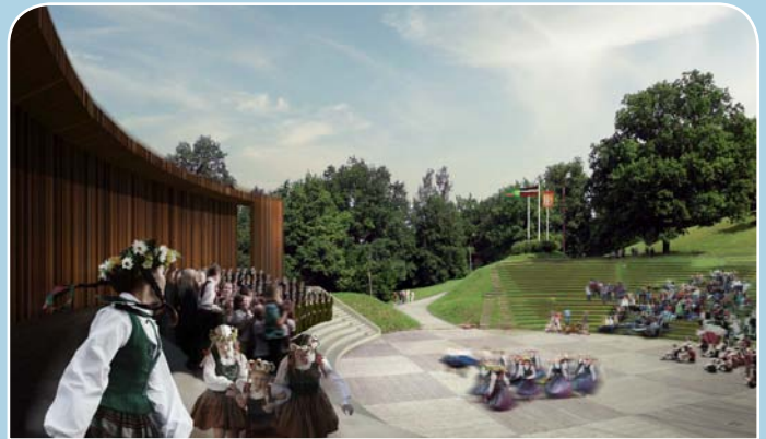
Talsu Sauleskalna brīvdabas estrādes projekta skice

Savukārt projekta „Ielu infrastruktūras uzlabošana Talsos sasniedzamības sekmēšanai 1.kārta” ietvaros ir paredzēts