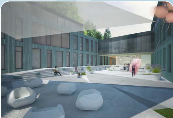
Talsu Radošās sētas projekta skice

Rekonstruējot un paplašinot Talsu tautas namu, mūzikas skolu un iekšpagalma ēkas tiks izveidota Talsu Radošā sēta. Radošajā sētā un tās pagalmā būs pieejamas amatniecības darbnīcas, izstāžu zāle, telpas koncertiem