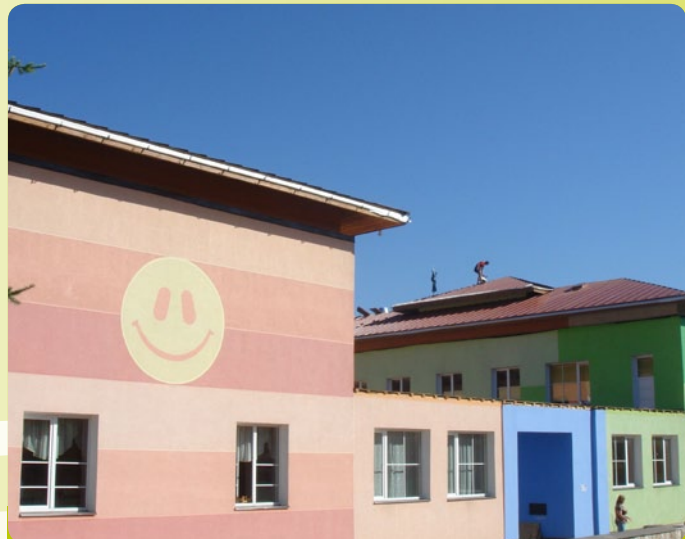
Cēsu 3. pirmsskolas izglītības iestāde

iestādes renovācija un Cēsu pilsētas 3.pirmsskolas izglītības iestādes renovācija.