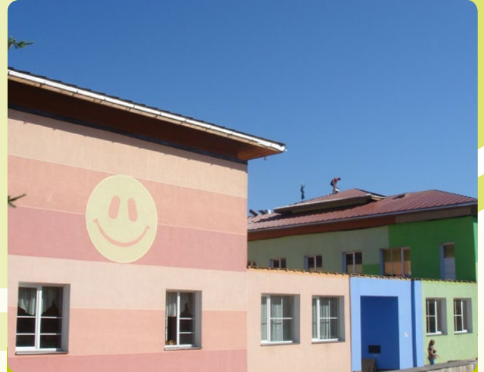
Cēsu 3. pirmsskolas izglītības iestāde

iestādes renovācija un Cēsu pilsētas 3.pirmsskolas izglītības iestādes renovācija.