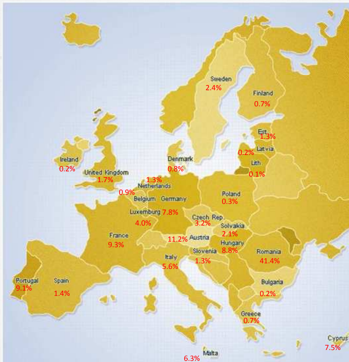
Zemnieku saimniecību darbības diversifikācija. Pārstrādes produktu ražošana 2007. gadā Datu avots: Eurostat. European Commission 2009. Agricultural statistics. Main results – 2007-2008.